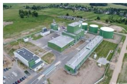
Слуцкий дрожжевой завод