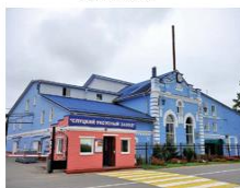
Слуцкий уксусный завод