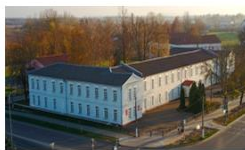
Слуцкий медицинский колледж