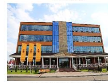
РУП «Слуцкие пояса»