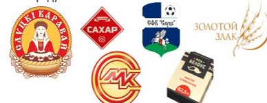
торговые марки Слуцка и Слуцкого района