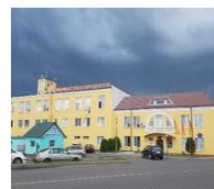
Слуцкий комбинат хлебопродуктов