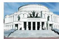
Большой театр оперы и балета