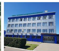
Слуцкий сыродельный комбинат