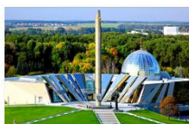
Музей истории Великой Отечественной войны