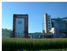
Слуцкий сахарорафинадный комбинат