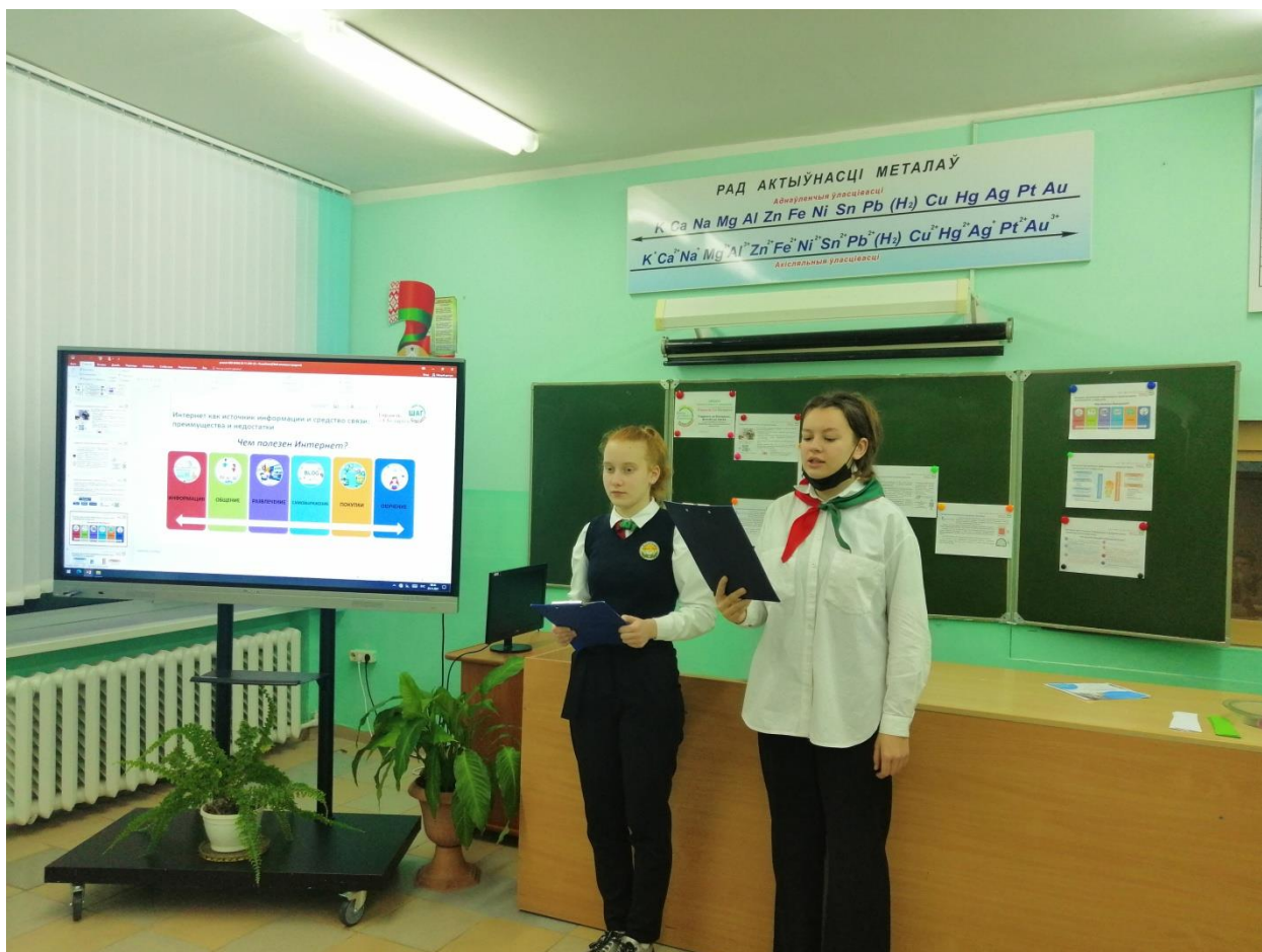
Выступленне ініцыятыўнай групы

Учащиеся просмотрели и обсудили видеоролик «Мы против мошенничества», составили плакат-памятку «Как не стать жертвой киберпреступления»