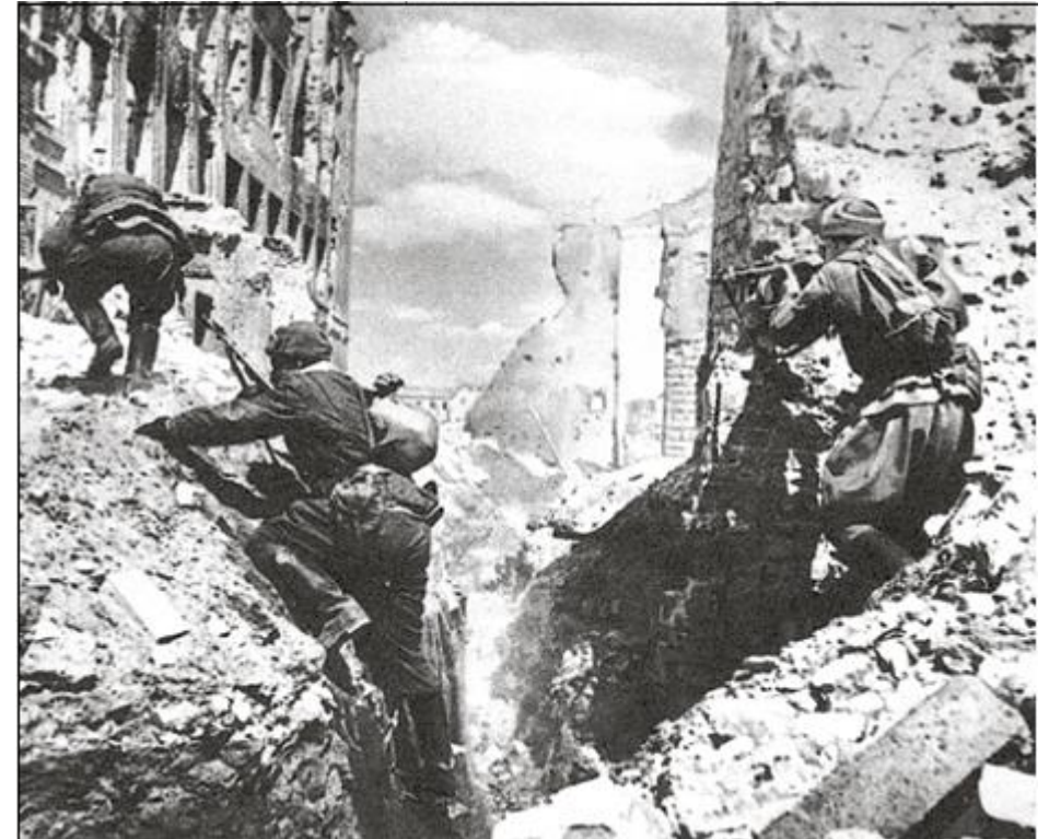
В Сталинграде бои шли за каждый дом