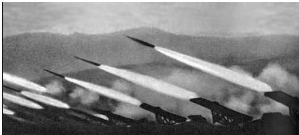
19 ноября 1942 г. залп реактивной артиллерии возвестил о начале контрнаступления под Сталинградом

В оборонительных боях советские войска нанесли значительный урон главной группировке противника и создали условия для перехода в контрнаступление, начавшееся 19 ноября 1942 г.