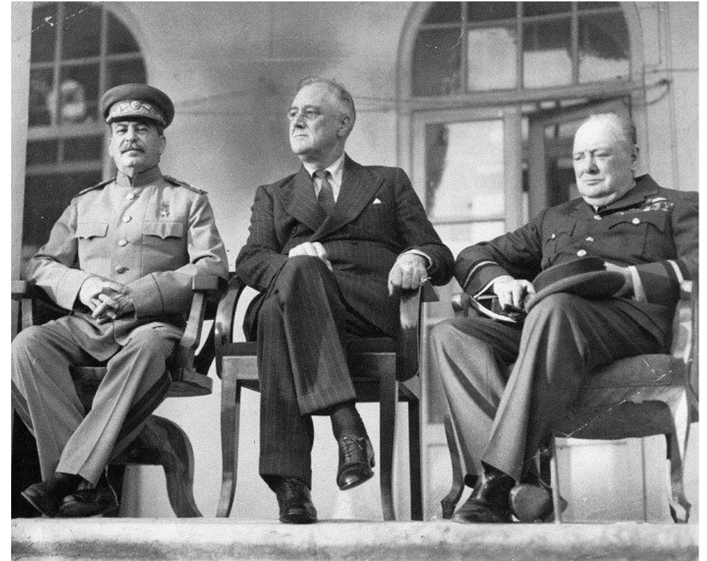
И. В. Сталин, Ф. Д. Рузвельт У. Черчилль в Тегеране

Конференция содействовала укреплению антигитлеровской коалиции и созданию международной системы безопасности после войны.