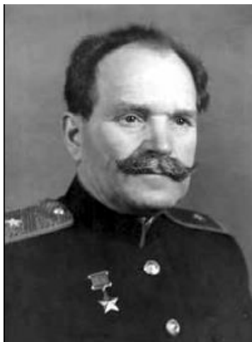
Василий Захарович Корж (партизанский псевдоним — Комаров; (1899—1967)

Организовал и возглавил один из первых в Беларуси партизанских отрядов, который с июня 1941 г. вел бои с оккупантами.