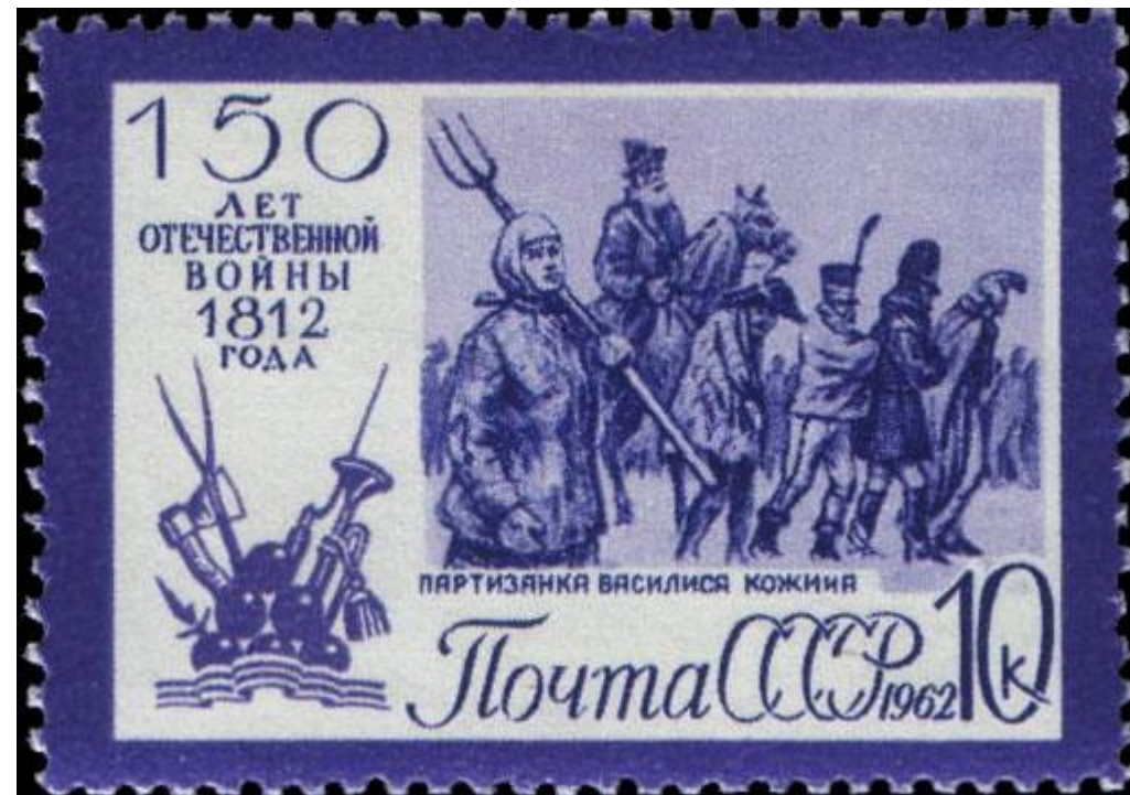
Партизанское движение в ходе Отечественной войны 1812 года

Партизанские действия известны с древности. К ним прибегали народы Средней Азии, сражаясь против войск Александра Македонского в IV веке до нашей эры, средиземноморские народы, отражая натиск завоевателей Древнего Рима .