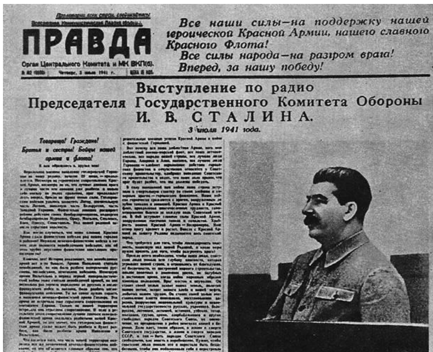
«Правда», 3 июля 1941 года. Обращение И. В. Сталина к советскому народу.

Директива Совнаркома Союза ССР и ЦК ВКП(б) № П 509 от 29 июня 1941 г. В ней впервые было сказано о необходимости организации партизанской войны в тылу врага