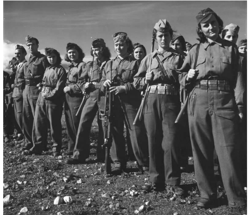
Греческие партизанки и партизаны в строю

Антифашистская борьба развернулась в: Польше, Франции, Югославии, Албании, Бельгии, Греции, Дании, Норвегии, Нидерландах, Чехословакии. Италии, Австрии, Румынии, Болгарии, Хорватии, Финляндии, Венгрии, Италии, Германии и Австрии, а также в нейтральных Швеции и Швейцарии.