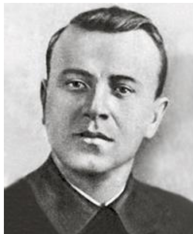
Тихон Пименович Бумажков (1909—1941)

Один из организаторов и руководителей партизанского движения на территории Полесской области.