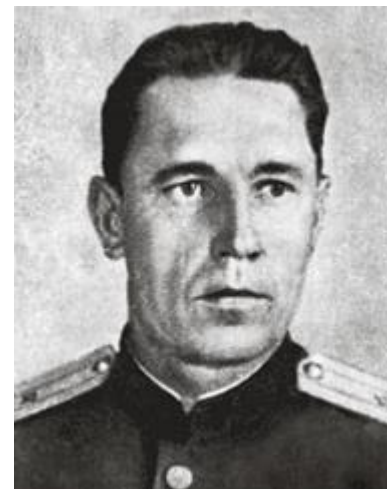
Федор Илларионович Павловский (1908—1989)

Один из организаторов и руководителей партизанского движения на территории Полесской области.