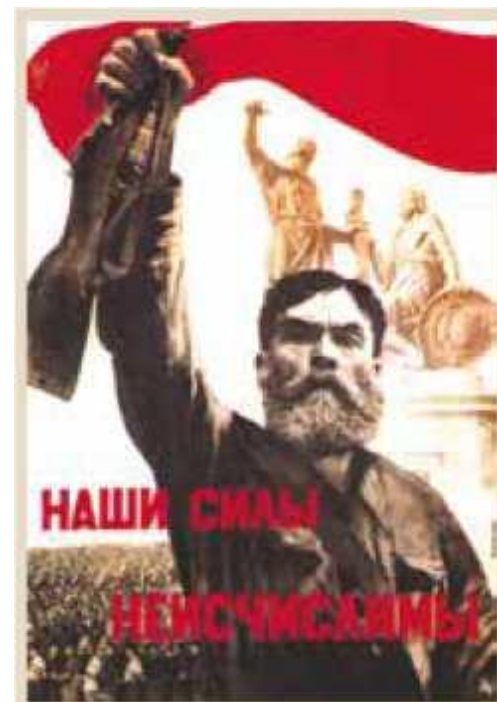
Плакат «Наши силы неисчислимы». Художник В. Корецкий. 1941 г.